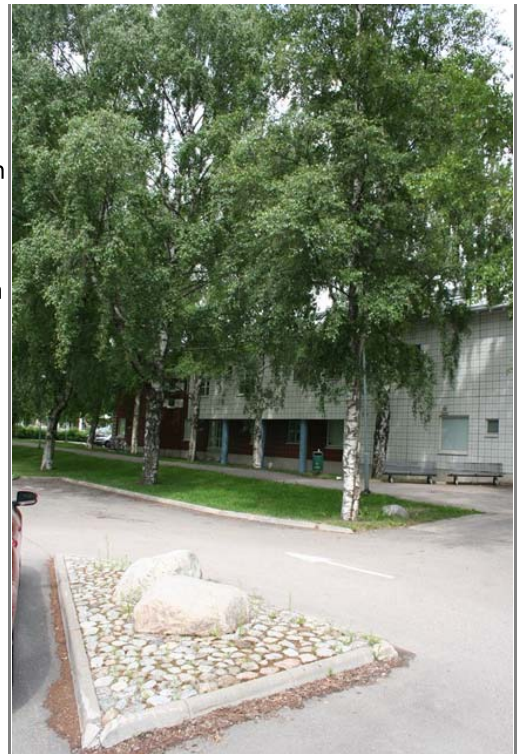
Malminkartanon terveysasemalla pihaa on korjattu muutama vuosi sitten. Kiinteistö on nyt paljon siistimmän ja hoidetumman näköinen kuin ennen. Autojen pysäköintialueen uudistaminen oli yksi osa remonttia samoin kuin jätteiden käsittelypisteiden uusiminen.

- Moni urakoitsija tuntuu kulkevan enemmän laput silmillä vain urakkaan liittyviä asioita tuijottaen. ISS on ymmärtänyt, että aktiivisuus on etu myös heille, koska useimmitenhan ne havainnot kirjautuvat työääräimiksi ja erikseen laskutettaviksi lisätöiksi viherurakoista vastaavalle yritykselle, Pirttijärvi muistuttaa.