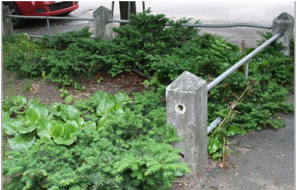
Myös Kirstinkujan varressa olevat Sturenkatu 8:aan kuuluvat piha-alueet on hoidettu. Istutukset tuovat iloa mm. kadun toisella puolella olevassa Työväen asuntomuseossa vieraileville.

Olemme saavuttaneet ehdottomasti ne tavoitteet, joita viherhoitotyön irrottaminen omaksi urakkeksi haettiin, Pirttijärvi kiittää päättymässä olevan sopimuskauden tuloksia.