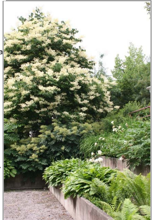
Sturenkatu 8:n sisäpiha on yhtä kokonaisuutta viereisen Helsingin Palveluasuntojen talon kanssa. Kesän kukoistuksessa ja hyvin hoidettuna piha-alue on viihtyisä keidas.

- Kilpailutuksessa katsotaan sekä laatua että hintaa. Tarjouspyynnön saaneet