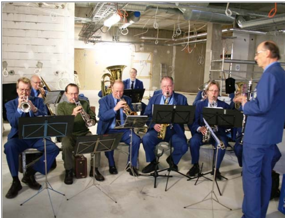
Helsingin Liikennelaitoksen soittokunta viihdytti myös harjannostajaisyleisöä Kontulassa.

- Vedenkäsittelyurakoitsija: Suomen Allaslaite Oy