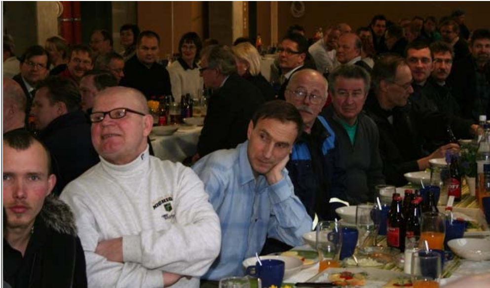
Rakentajat viihtyivät harjannostajaisissa.