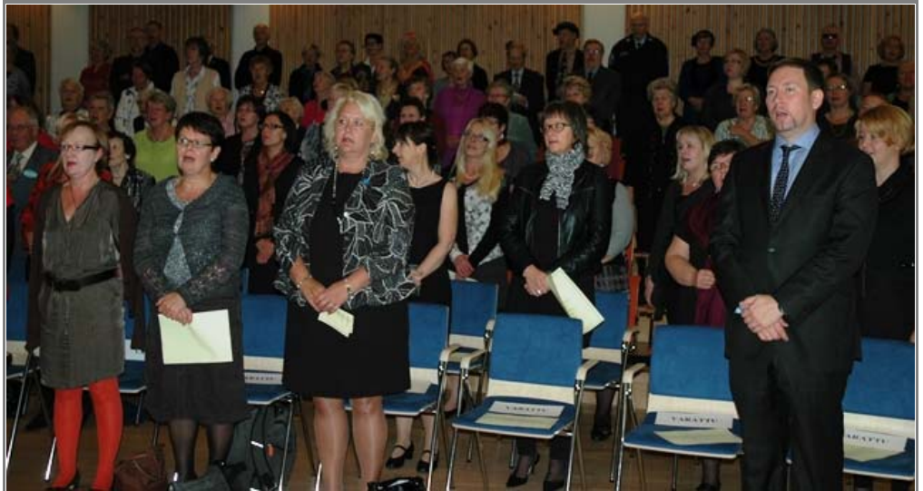
Lopuksi kajautettiin yhdessä komeasti Maamme-laulu.

Kiinteistö Oy Helsingin Toimitilat Puh: (09) 310 70 110 info@helsingintoimitilat.fi