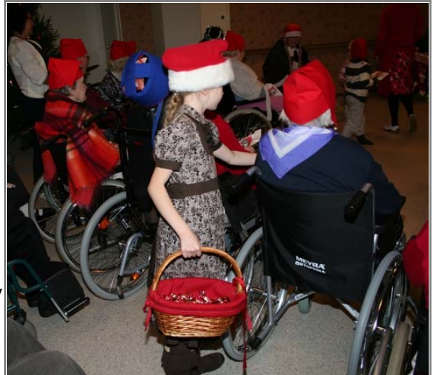
Osaston 3 pikkujoulujuhlassa esiintyi ryhmä läheisen päiväkodin lapsia. Lapset toimivat myös tonttuina juhlissa jakaen niin lahjat kuin pientä herkkupalaa osaston asukkaille.

Vanhainkodissa on kerroksissa 2-5 pitkäaikaisia ryhmäkotipaikkoja sellaisille helsinkiläisille vanhuksille, jotka tarvitsevat jatkuvaa apua. Kuudennessa kerroksessa on kuntoutus- ja arviointi osasto, jossa on kaksi 15-paikkaista ryhmäkotia ja neljännessä kerroksessa yksi 14 -paikkainen ryhmäkoti, joka tarjoaa vuorohoitoa kotona hoidettaville muistisairaille.