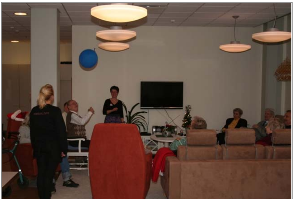
Päivätoiminnan tiloissa käy joka päivä eri ryhmä kotona asuvia vanhuksia kuntoutumassa ohjatussa toiminnassa.

Viereisen Kontulan vanhan vanhustenkeskuksen ohella uuteen Kontulan vanhustenkeskukseen muuttivat satelliittiyksiköt Koskelan sairaalasta ja Roihuvuoresta. Uudessa keskuksessa on enemmän asuntopaikkoja kuin vanhassa, mikä mahdollisti satelliittien asukkaiden ja henkilökunnan siirtymisen myös uusiin tiloihin.