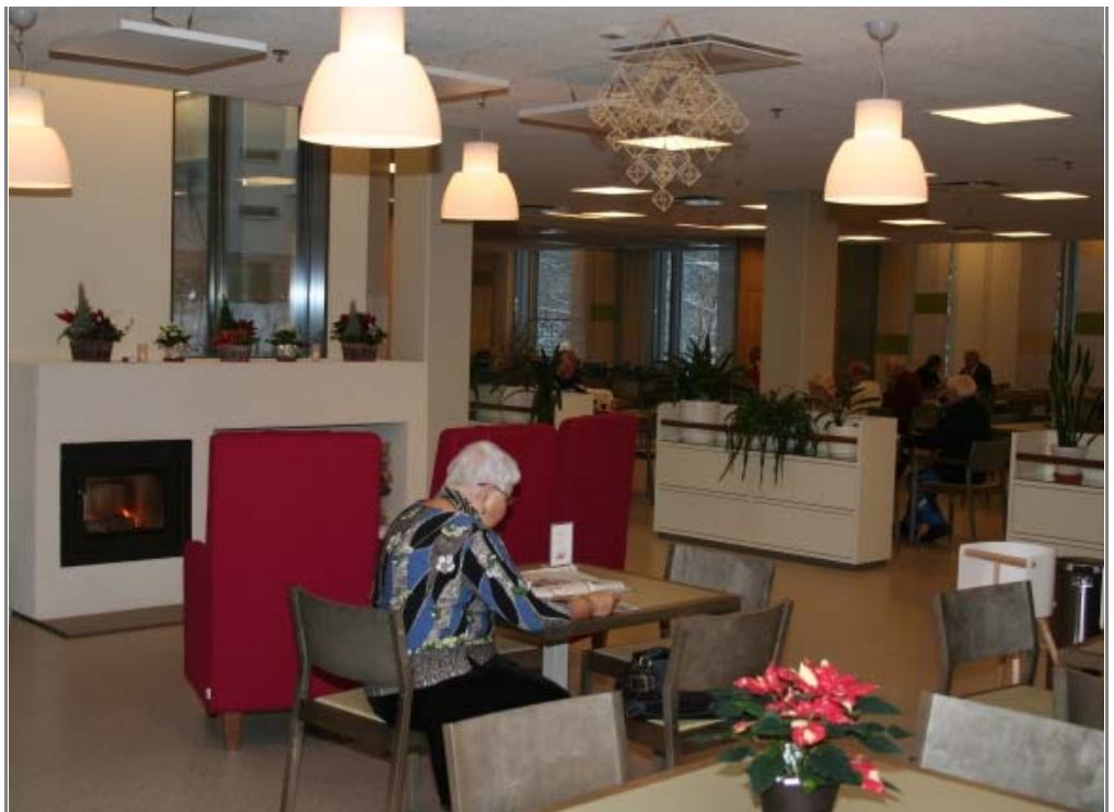
Ala-aulan takkatilassa on lämmin tunnelma ja viihtyisä ympäristö vaikka istahtaa lukemaan päivän lehti.