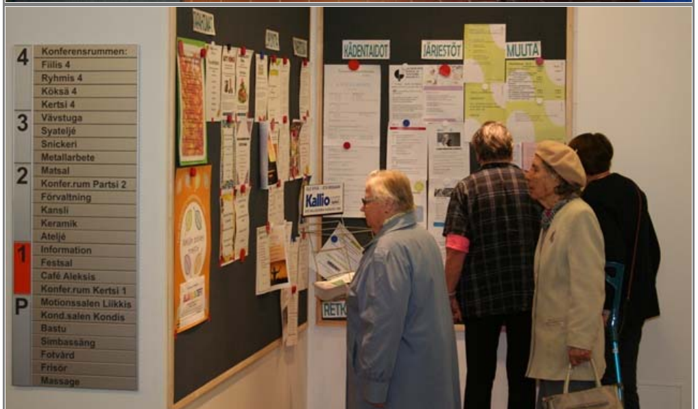
Aulatilat ovat valoisat ja avarat mm. istua ja jutella, pitää myyjäisiä ja hyödyntää talon infon palveluita sekä mm. saada tietoa vaikkapa järjestöjen toiminnasta.