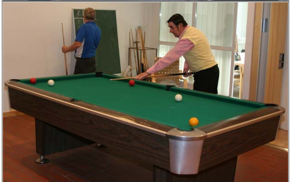
Uusi kuntosali, puutyötilat ja biljardipöytä ovat myös ahkerassa käytössä.