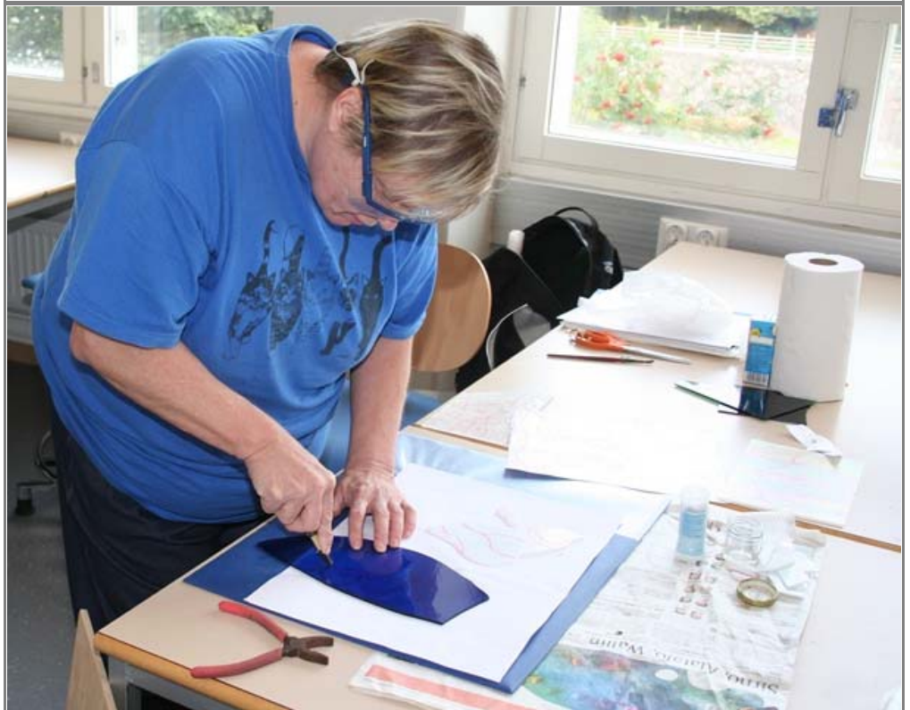
Keramiikkatyöt ovat todella taidokkaita.